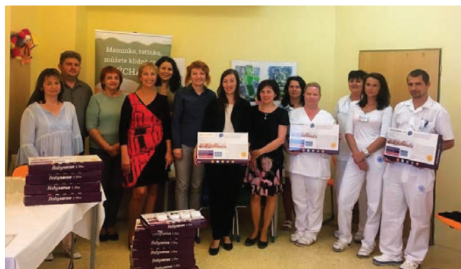
Předání monitorů v Rychnově nad Kněžnou

Nadační fond – Nadace křižovatka dne 5. 10. 2018 předal oběma našim porodnicím v Náchodě a Rychnově nad Kněžnou nové monitory dechu Babysense 1.