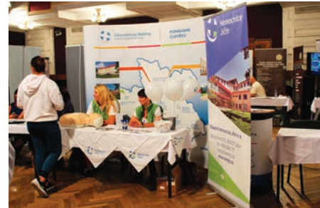
19. – 20. 10. 2018, Jičín

a další zdravotníky, společně lákaly nové žáky ke studiu v tomto oboru. Cílem bylo jim mj. ukázat, jaké jistoty a stabilitu oblast zdravotnictví v jejich budoucím profesním životě poskytuje. -MD-