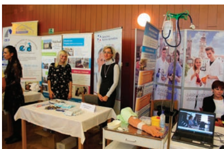
5. – 6. 10. 2018, Rychnov nad Kněžnou