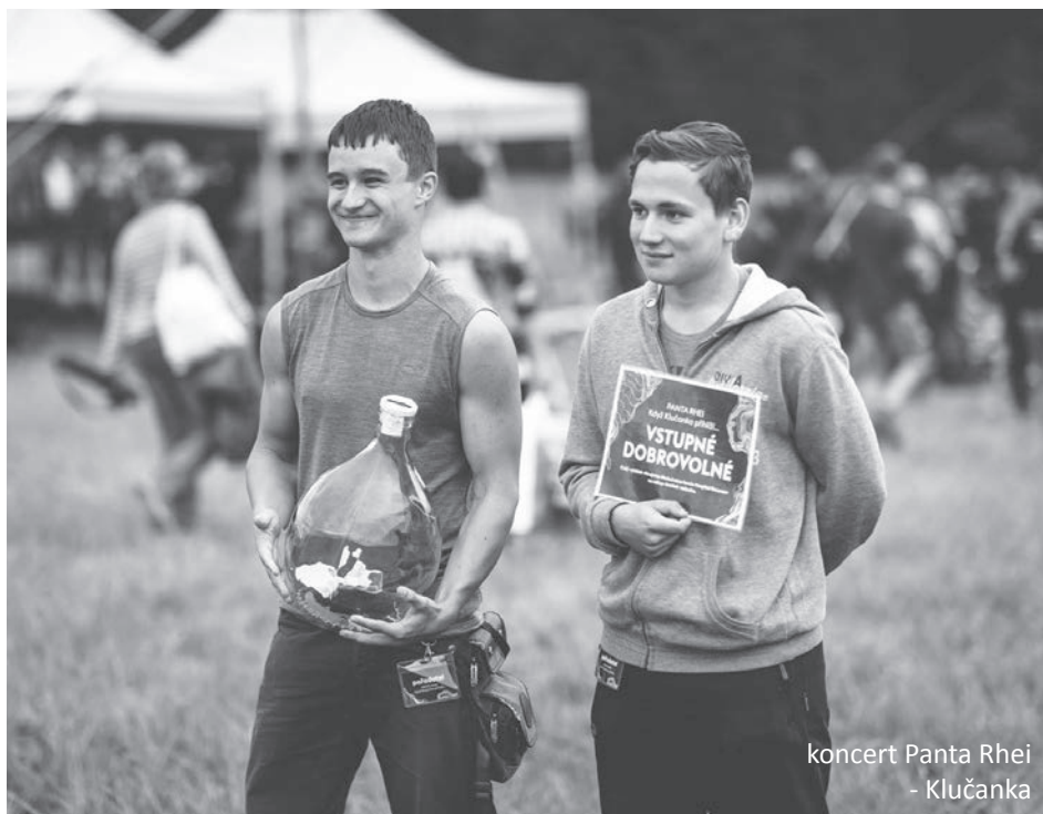
koncert Panta Rhei - Klučanka