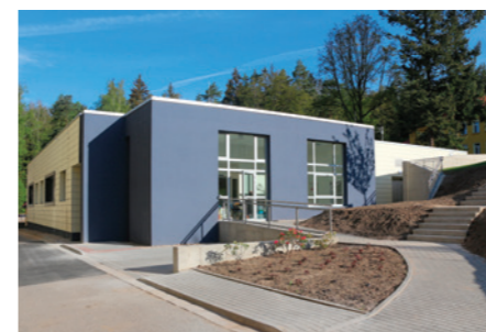
Budova nových laboratoří

financoval Královéhradecký kraj, zhruba 8 milionů korun přispěla královédvorská společnost JUTA a.s.