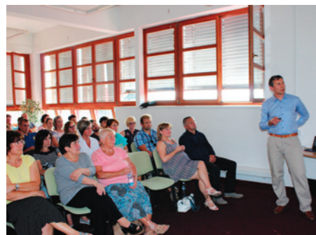
Přednáška o historii interny