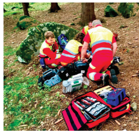
Zásah ZZS v nepřístupném terénu