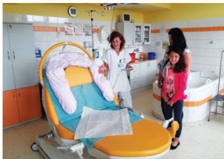
Porodnice ON Náchod

Den otevřených dveří porodnice a novorozeneckého oddělení se konal v Náchodě v červnu, v srpnu se pak otevřely budoucím maminkám prostory porodnice v Rychnově nad Kněžnou. Podívat se na oddělení i do porodních sálů a informovat se možnostech služeb při porodu se přišly zhruba dvě stovky zájemců. Byly mezi nimi jak samotné rodičky, tak i jejich manželé, partneři či budoucí babičky a sourozenci.