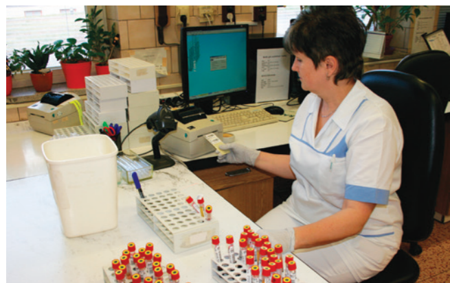
Centrální klinické laboratoře

V minulém čísle jsem prezentoval několik postřehů týkajících se kontroly a sledování kvality v nemocnicích. Dnes bych rád navázal na kontrolu kvality týkající se laboratoří. Prověřování systému řízení laboratoře probíhá obvykle bez mediálního zájmu, takže bude dobré několika slovy připomenout, o co tady jde. Předem si musíme uvědomit, že bez laboratorních výsledků nelze léčit. Správně a včas provedené vyšetření považujeme za naprostou samozřejmost a jediný zájem médií vzniká, když se stane nehoda, např. záměnou vzorků apod., se špatným koncem. Audit je právě ověření, že vše, co se v laboratoři děje, je plně pod kontrolou a v rámci jasně stanovených metodických postupů lege artis. V srpnu prošly následnou kontrolou i naše centrální laboratoře. Pod vedením prim. Prokopcové jsme úspěšně absolvovali Dozorový audit B, kterým jičínská nemocnice obhájila podmínky