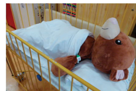
Médu Bědu jako „pacient“

Den otevřených dveří dětského oddělení trutnovské nemocnice měl zajímavý průběh i program. Na návštěvu za nemocnými dětmi přišly 14. června děti z ma-