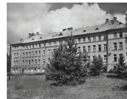
Hlavní budova nemocnice v 30. letech 20. století a dnes

Královédvorská nemocnice působí v současném areálu od roku 1927. Letos tomu je tedy právě 90 let, co poskytuje zdravotní služby obyvatelům Dvora Králové nad Labem a jeho okolí. Rozsah poskytované péče se postupem času měnil, nyní nemocnice nabízí pro spádovou oblast královédvorská akutní lůžkovou péči chirurgickou a interní a pro širší region také urologickou.