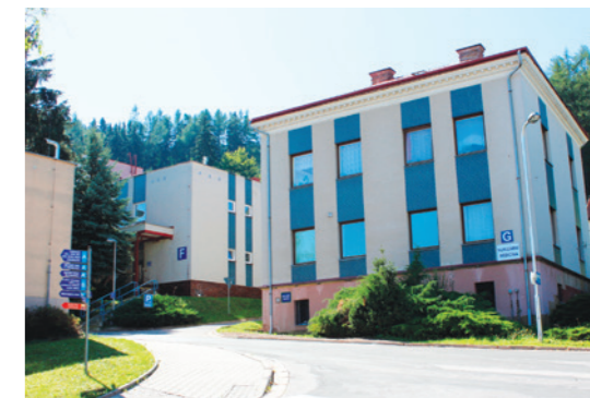
Oddělení nukleární medicíny, budova G

zatím udělována výjimka do doby, než bude navrženo a realizováno nápravné řešení. Přes opakovaná jednání a žádosti o prodloužení výjimky do doby výstavby nových laboratoří nebylo nemocnici vyhověno a SÚKL požadoval nápravné opatření ještě letos. Proto byla zadána studie úprav stávajícího prostoru, které by splňovaly požadovaná kritéria, ale zároveň znamenaly minimální investiční náklady. Projektanti tedy navrhli stavební rozdělení prostor a nové řešení vzduchotechniky a elektroinstalace. Probíhající rekonstrukce se tedy týká pouze části 2.NP a 3.NP, podkroví, kde má být umístěna klimatizace. „Zachování provozu výroby radiofarmak je důležité nejen z hlediska zabezpečení těchto léčiv pro potřebu pacientů Oblastní nemocnice Trutnov, ale také z hlediska ekonomického. Stavební úpravy jsou tak sice dočasné, ale z důvodu zabezpečení zdravotní péče o pacienty pro nejbližší období až do plánované výstavby nového zařízení nezbytné,“ vysvětluje situaci místopředseda Zdravotnického holdingu Královéhradeckého kraje Ing. Marian Tomášik, MBA. Krajskou zakázku vyhrála v květnu firma REVIST s.r.o. s cenou cca 3 050 000 Kč s DPH. Hotovou stavbu