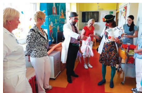
Křest časopisu na dětském oddělení

Pondělní odpoledne bývají na dětském oddělení náchodské nemocnice ve znamení legrace. Již několik let tam malé pacienty chodí bavit Zdravotní klauni v rolích veselých doktorů a sestřiček a jinak tomu nebylo ani v pondělí