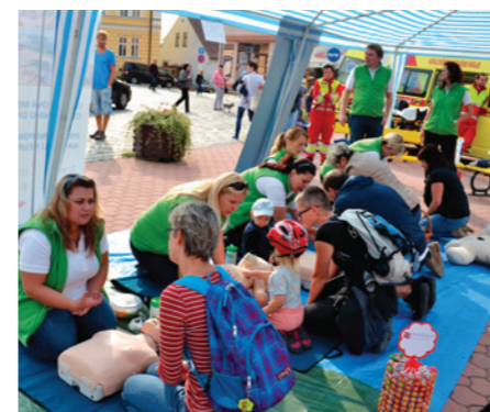
První pomoc na Žižkově náměstí v Jičíně

Oblastní nemocnice Jičín a.s. již po šesté v řadě pořádala v rámci Světového dne první pomoci ukázkové dopoledne, kde se veřejnost seznámila s postupy, jak člověku s náhlými komplikacemi se zdravím včasným zásahem pomoci, případně i zachránit život. Letos se akce konala v sobotu 9. 9. 2017 dopoledne na Žižkově náměstí v Jičíně, a to ve spolupráci se složkami integrovaného záchranného systému a městem Jičín.