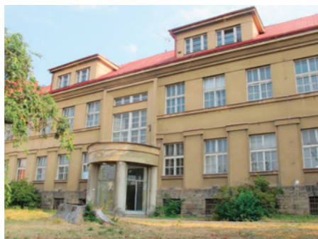
Stará budova interny