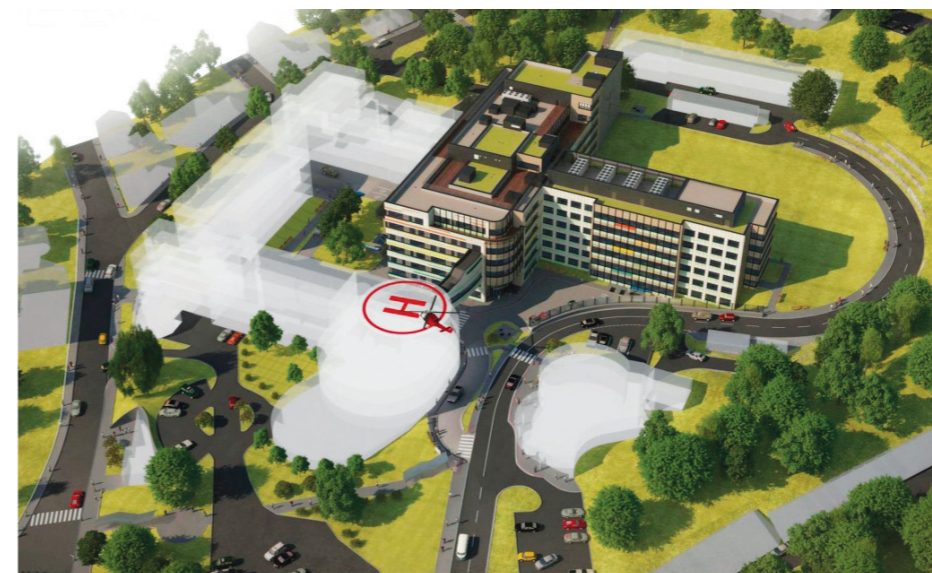
Vizualizace budoucí podoby areálu

ně šestiměsíčního zkušebního provozu. Jako základní hodnotící kritérium veřejné zakázky je stanovena ekonomická výhodnost nabídky, která bude hodnocena podle nejnižší nabídkové ceny. Klade se ale také důraz na odbornost uchazečů. Je požadováno prokázání kvalifikace na základě seznamu staveb realizovaných v posledních pěti letech, který bude obsahovat minimálně jednu novostavbu, nebo rekonstrukci stavby pozemního stavitelství o finančním objemu minimálně 500 milionů korun bez DPH, minimálně jednu další novostavbu, nebo rekonstrukci objektu sloužícího pro zdravotnickou péči o nákladech minimálně 100 milionů korun bez DPH a minimálně jednu realizaci stavebních prací, jejíž součástí bylo vybudování tzv. čistých prostor ve zdravotnickém zařízení (např. operační sály) s minimální plochou 150 m 2 .