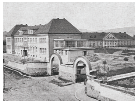
Historické foto z výstavby areálu nemocnice